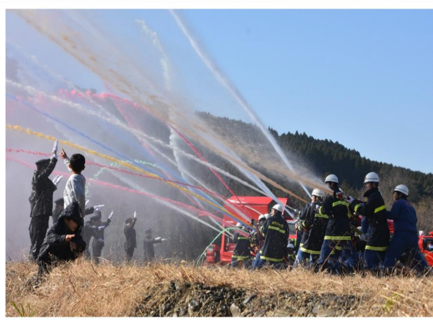
未来の消防士