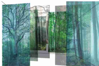
進藤 環 作品イメージ「風になる in 綾」