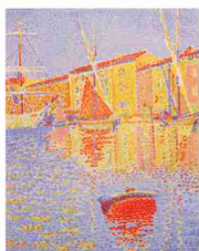
シニャック「フィ (サン・トロベ)」

宮崎県立美術館収蔵作品の展示 [会場] 日南市生涯学習センターまなびピア/綾てるは図書館 ○学芸員によるギャラリートーク 10/27、11/3、20、24