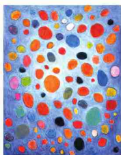
瑛九「赤のあつまり」